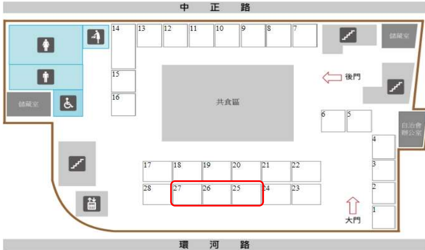
淡水區中正公有零售市場攤(鋪)位置圖