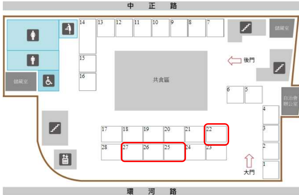
淡水區中正公有零售市場攤(鋪)位圖